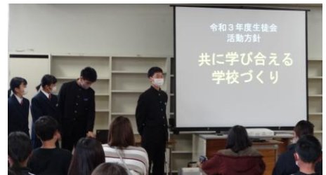
生徒会3年生から学校行事の紹介