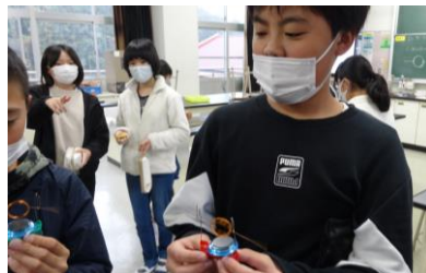
クリップモーターを作った！