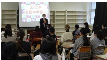
真剣に話を聞く6年生！